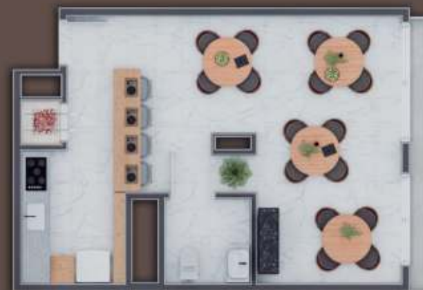
Salão de festas